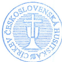
ThDr. Tomáš Butta, Th.D. patriarcha